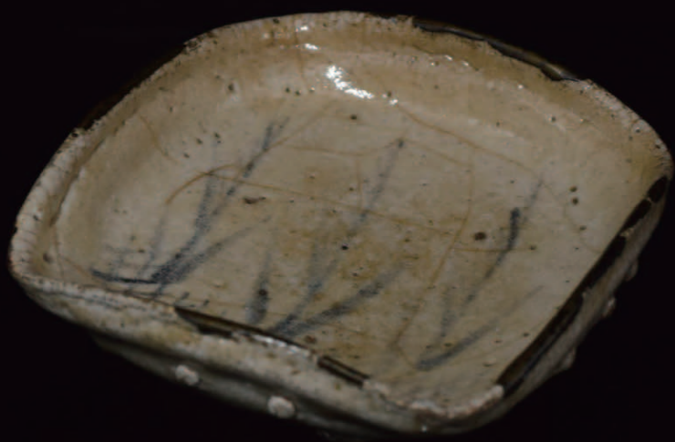
志野三足向付 桃山時代